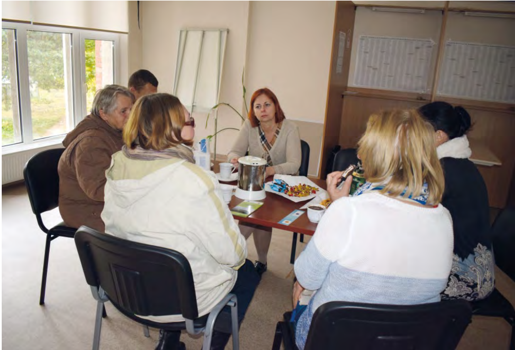
Susitikimas seniūnijoje su bendruomenės nariais