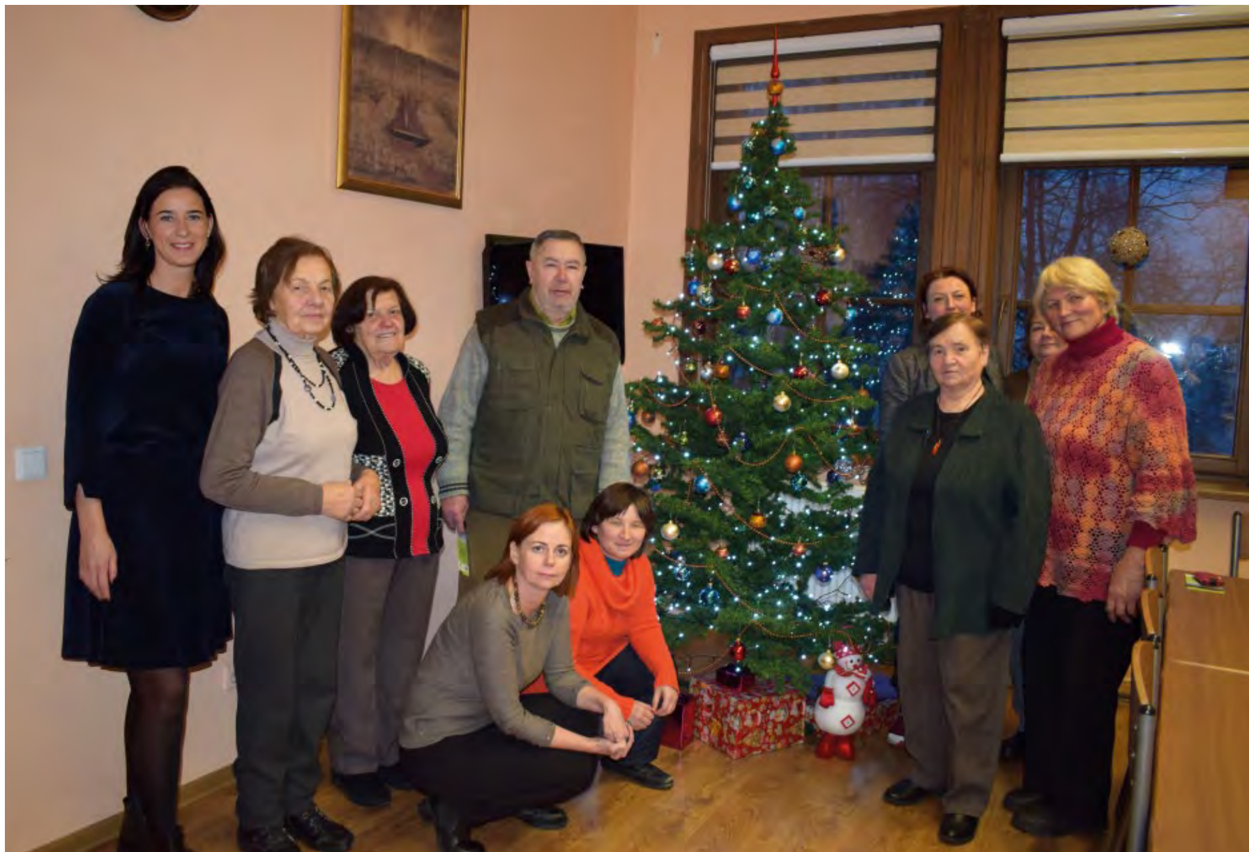
Smagu švęsti kartu