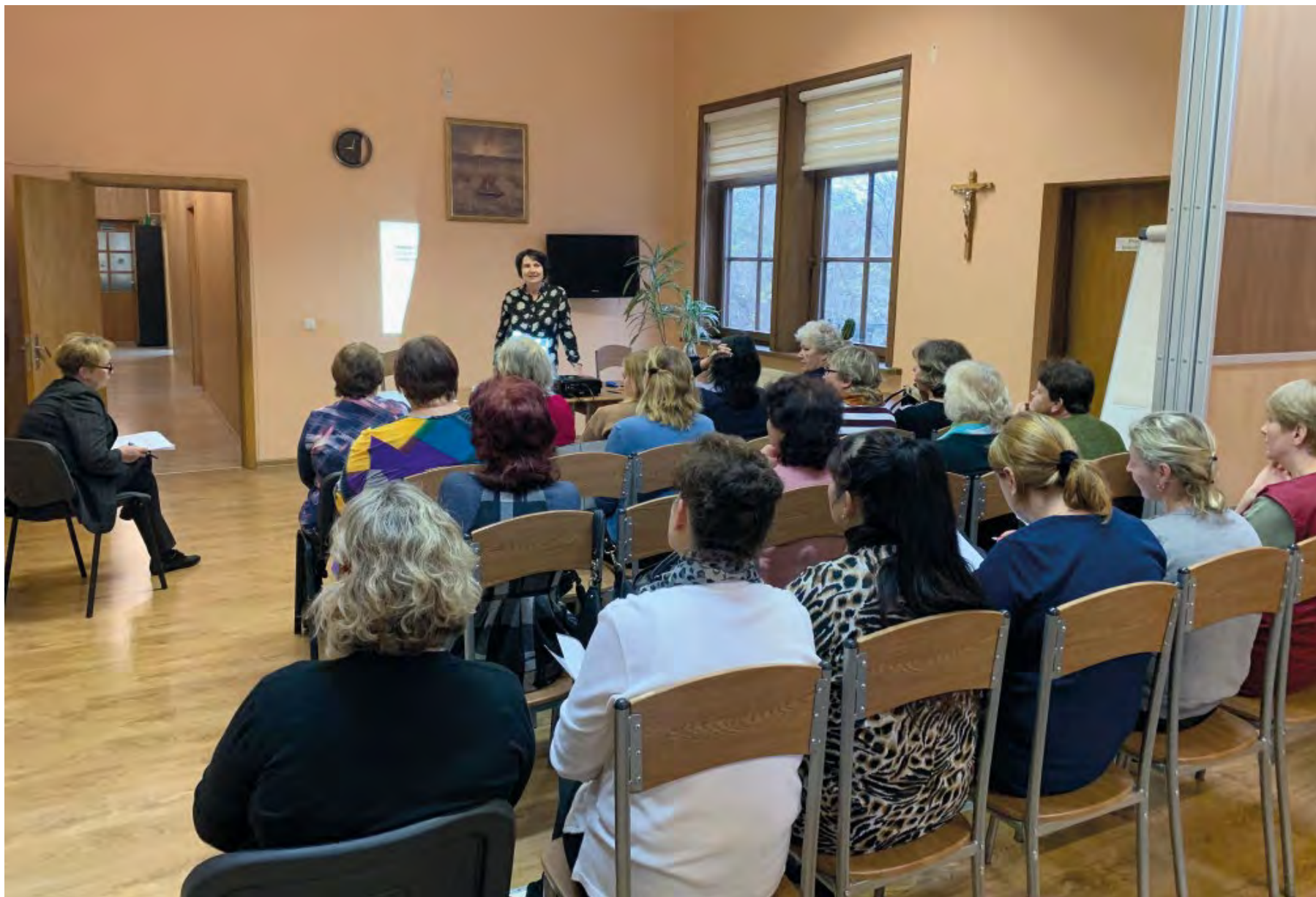
Vyksta darbuotojų mokymai