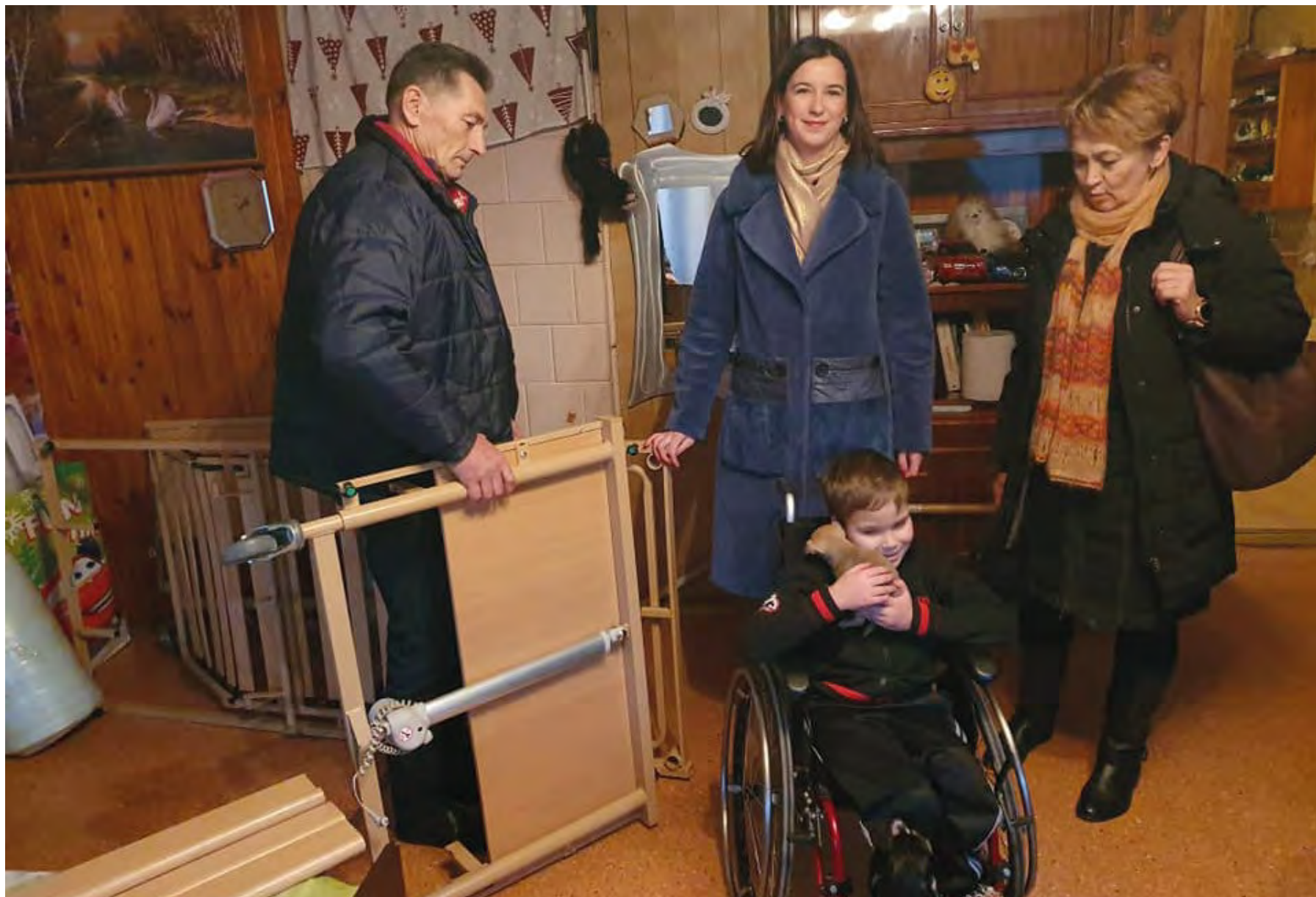
Mažasis paslaugų gavėjas džiaugiasi nauja funkcinė lova